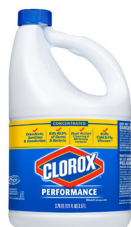
Clorox Regular Bleach®